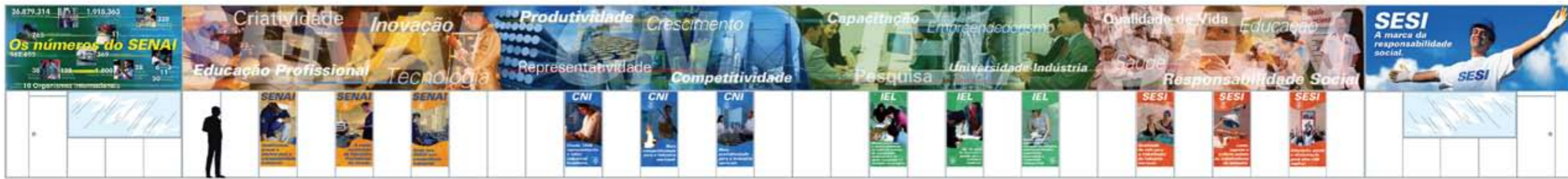
Stand SISTEMA S

Projeto: Brindes, bôtons, camiseta, diploma, certificado, banners e painéis para a Olimpíada do Conhecimento 2004, evento promovido pelo Senai/DN, na cidade de Belo Horizonte/MG