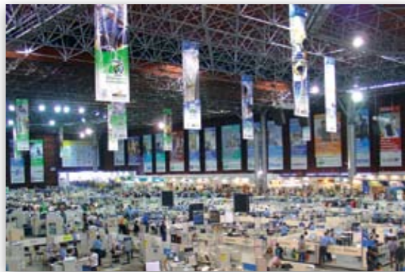
Vista geral - Pavilhão